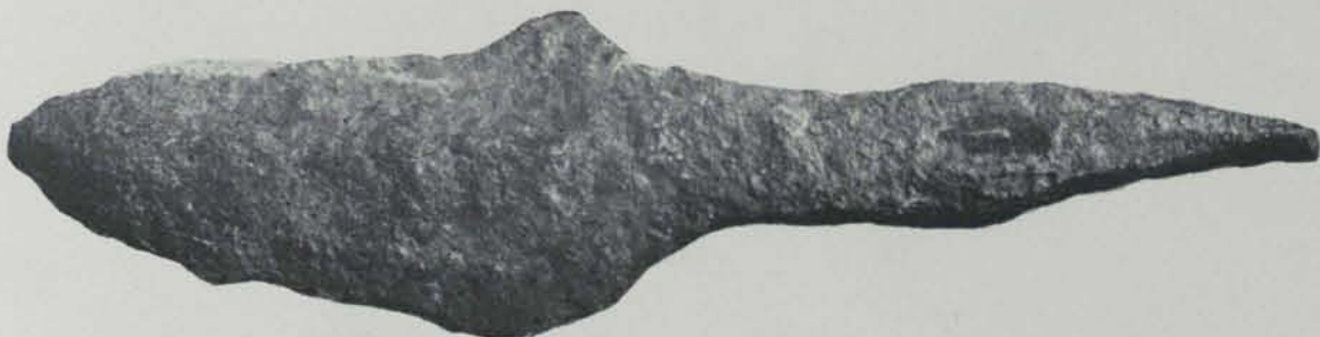
Fig. 116. — Tivissa. Rella de ferro

29 monedes d'argent. — Són totes més o menys d'una mateixa època, i fan ver semblant que tots els objectes pertanyin a una sola troballa, ja sigui feta a Tivissa o en un altre lloc. Aquestes monedes, suposada la unitat de la troballa, permeten datar-la. El professor de Numismàtica de