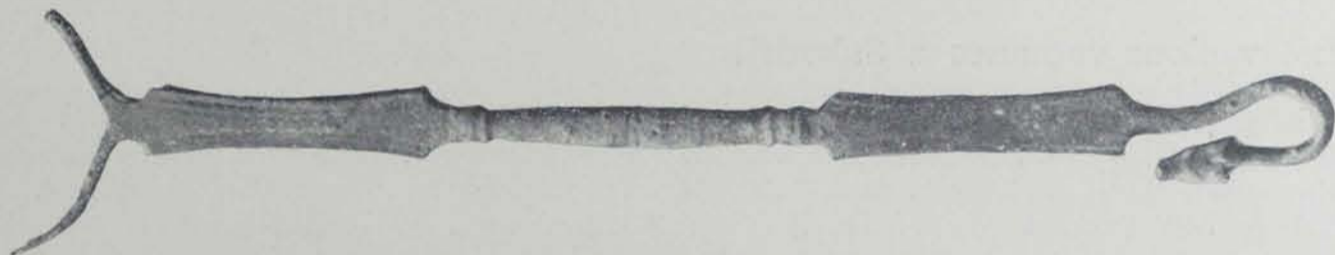
Fig. 115. — Tivissa. Màneg d'espill, de bronze

Or. — 6 arracades (fig. 113, part superior). Les formen unes anelles bastant groixudes, tancades per un fil d'or i ornades amb cordonets retorçats, aplicats sobre una lamineta molt prima