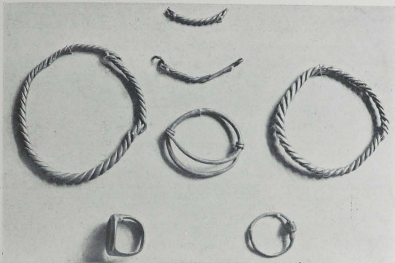
Fig. 114. — Tivissa. Objectes d'argent*

la qual es veuen escassos fragments de ceràmica ibèrica pintada, sense res de notable. Enlloc es veuen restes de paret. A Tivissa quasi s'ignora la troballa i després de moltes indagacions s'aconseguí saber tant sols que alguns que la coneixien dubtaven que fos feta en aquell terme.